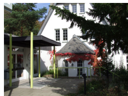
Bildungshaus Zeppelin, Goslar