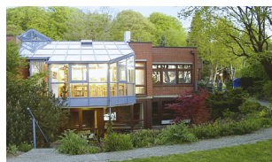
Ev. Bildungszentrum Bad Bederkesa