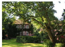
Ev. Bildungszentrum Ostfriesland – POTSHAUSEN